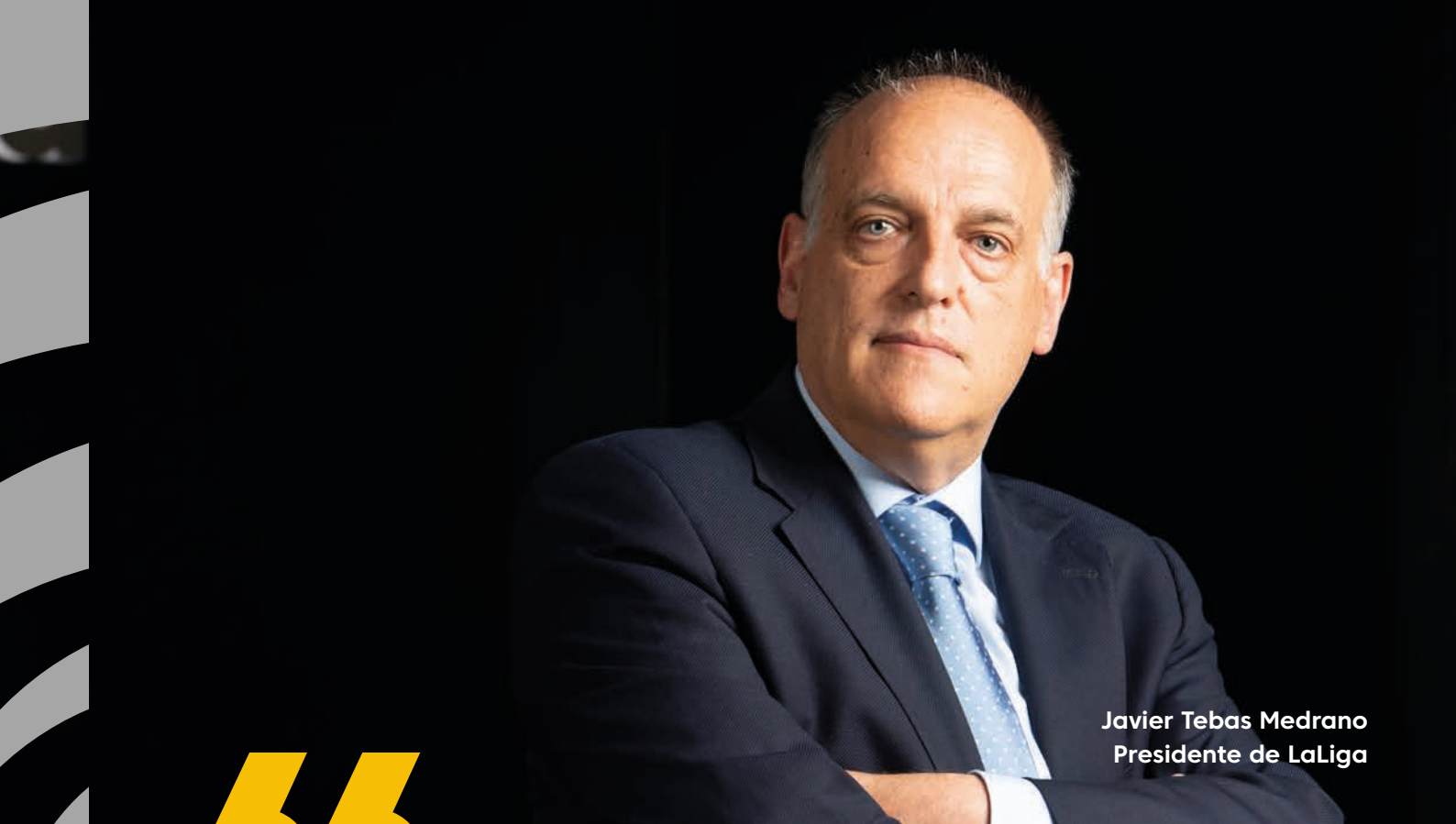
Javier Tebas Medrano Presidente de LaLiga