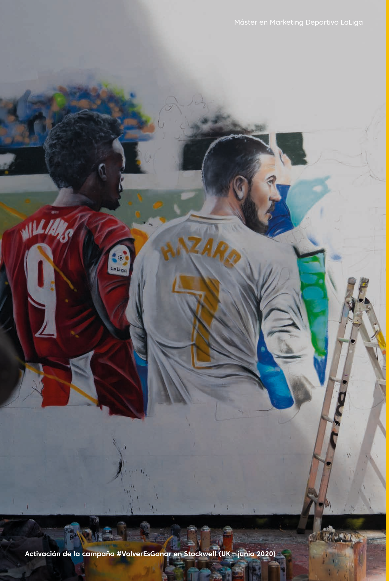
Activación de la campaña #VolverEsGanar en Stockwell (UK - junio 2020)