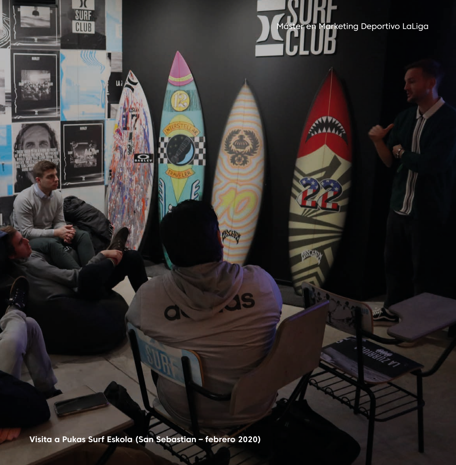
Visita a Pukas Surf Eskola (San Sebastian – febrero 2020)